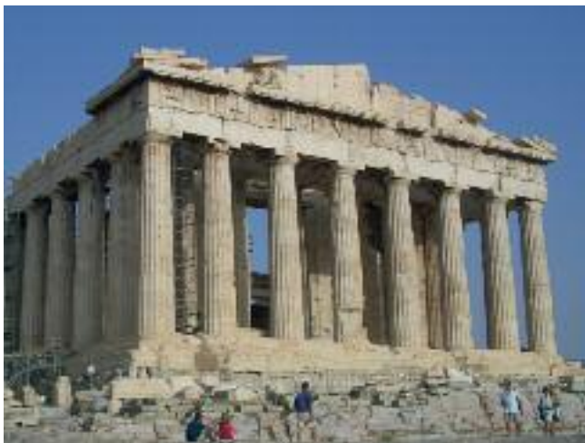
Prototypisch für den Goldenen Schnitt: der Parthenontempel.

Die bislang erschienenen StadtZeit-Beiträge sind über die Redaktion zu beziehen.