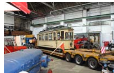
Ausstellungsdepot im ehemaligen Henschelwerk in Rothenditmold