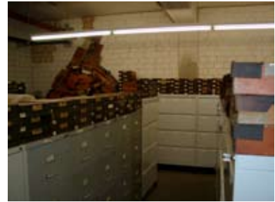
Magazin E1 mit Einwohnermeldekartei