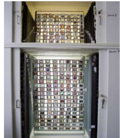
Diamagazin im Medienarchiv