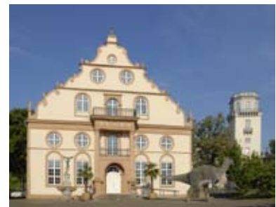
Haupteingang des Naturkundemuseums

Das Ottoneum, in dem sich das Naturkundemuseum seit mehr als 120 Jahren befindet, ist eines der wichtigsten historischen Gebäude der Residenzstadt Kassel. Ursprünglich als erster feststehender Theaterbau Deutschlands in 1606 eröffnet, diente es nur kurze Zeit seinem ursprünglichen Zweck und erfuhr in seiner Geschichte vielfache Nutzungsänderungen. Seit 1928 befindet sich das Naturkundemuseum in städtischer Trägerschaft. 1943 wurde das Gebäude schwer beschädigt und über die Hälfte der Sammlung ging verloren. Gestützt auf historische Pläne wurde das Ottoneum 1949–1954 wieder aufgebaut. Die Sammlungsbestände konnten bis heute durch Ankäufe, Schenkungen aus Privatbesitz und eigene Forschungsarbeiten wieder erheblich vergrößert werden.