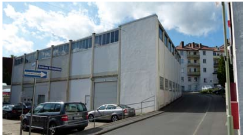
Vorder- und Rückseite Untere Karlsstraße 14