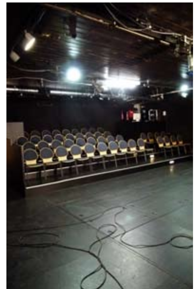
Studiobühne des Dock 4

Genauere Angaben sind erst nach Vorlage eines Nutzungskonzepts möglich. Die Umsetzungsschritte sind abhängig von der zukünftigen Nutzung.