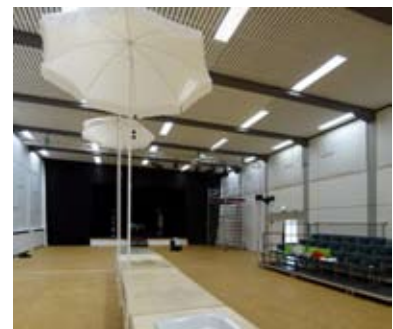
Große Veranstaltungshalle des Dock 4