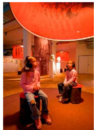
N. Klingner / Expo 2508