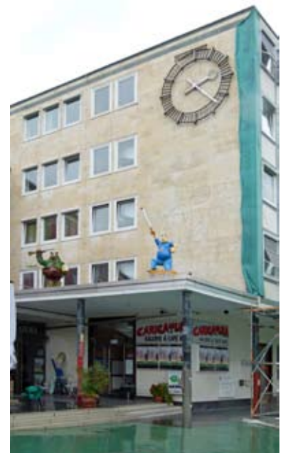
Kulturamt - D. Rothen

Die Caricatura – Galerie für komische Kunst – ist seit 1987 Ideenpool und Schauplatz erfolgreicher Ausstellungen und Veranstaltungen zu Karikatur und Cartoon, Kritik und Komik. Seit 1995 ist ihr Standort am Kulturbahnhof. Sie ist bundesweit eine der ersten Adressen für Satire und das zentrale Forum für die deutschsprachigen Vertreter des Genres. Die Caricatura fördert die Positionierung und Etablierung der komischen Kunst im Spektrum der Gegenwartskunst und entwickelt Programme zur Nachwuchsförderung. Die Räumlichkeiten der Caricatura sind nicht ihrer überregionalen Bedeutung entsprechend ausgebaut. Vor allem ihre durch die Ecklage bedingte Erschließung und ihre Präsenz zum Bahnhofsvorplatz hin sind stark verbesserungsbedürftig. Durch eine gezielte Nutzungserweiterung im derzeitigen Gebäudebestand und durch eine räumliche Verlagerung der Ausstellungsfläche unmittelbar an den Bahnhofsvorplatz angrenzend könnte eine deutlich verbesserte Präsenz erreicht werden. Die von der Stadt in 2009 aufgestockten Fördermittel für den laufenden Betrieb sollen verstetigt werden, reichen jedoch nicht zur Finanzierung dieser Maßnahmen. Ein EFRE-Projektantrag zur Förderung der Investition in Höhe von knapp 700.000 Euro zum Ausbau des Standortes Caricatura liegt mit positiver Beschlusslage vor; entsprechende Komplementärmittel sind bislang nicht vorhanden.