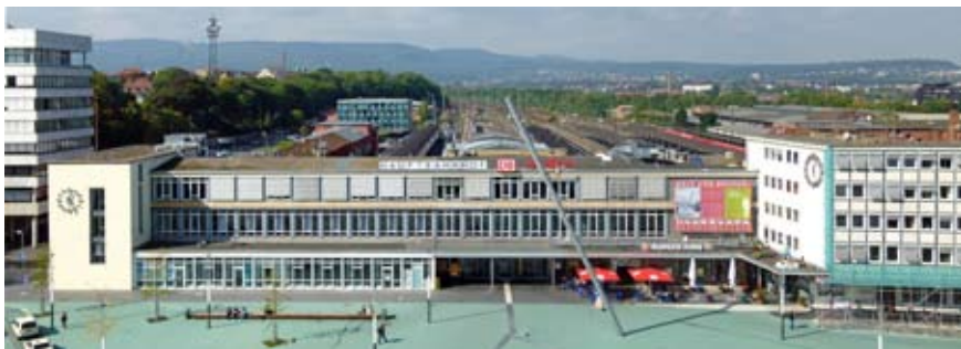
Kulturamt, D. Hothen