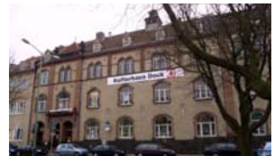
Eingangsseite des Dock 4

Im Rahmen der Sanierung Innenstadt wurde Anfang der 90er Jahre die hinter dem Fridericianum gelegene ehemalige Gerhart Hauptmann-Schule zum innerstädtischen multifunktionalen Kulturzentrum Dock 4 umgenutzt.