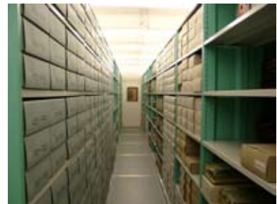
Magazin E3 mit Rollregalanlage