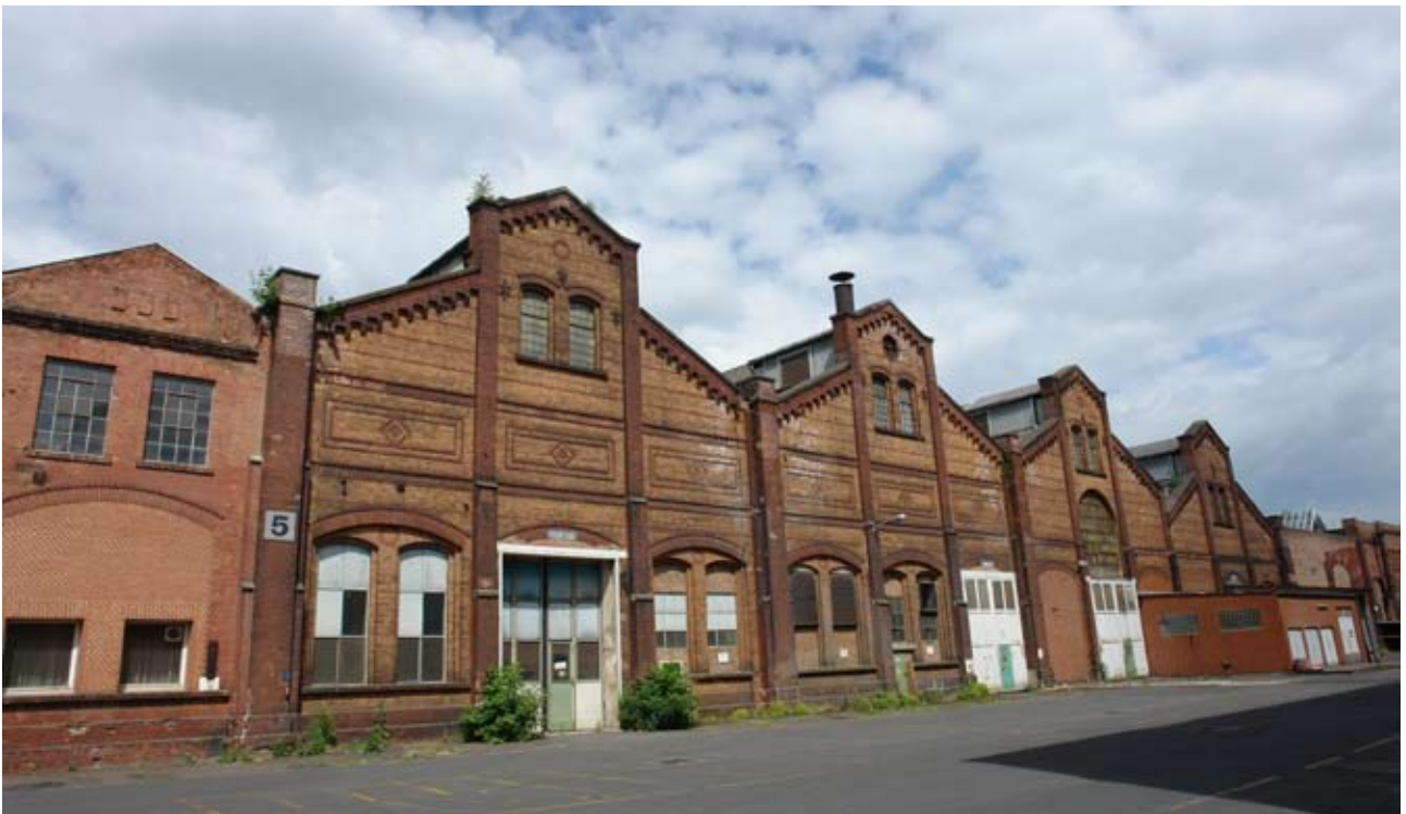
Die Kesselschmiede im ehemaligen Henschelwerk in Rothenditmold

Mittelfristig strebt der Verein TMK eine Ausweitung der Flächen innerhalb des ehemaligen Rothenditmolder Werksgeländes an. Bevorzugter Standort wären dafür die denkmalgeschützte Hallen der ehemaligen »Kesselschmiede«.