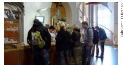
Werkstattbereich im Kulturhaus Dock 4