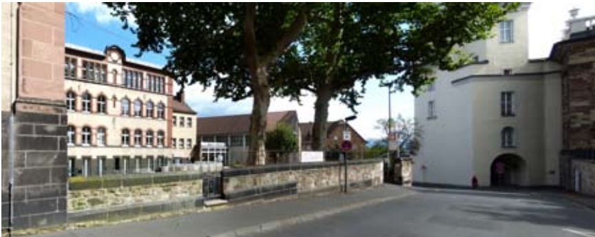
Hofseite des Dock 4. Platzsituation mit der Straße »Hinter dem Museum«

Das Kulturhaus Dock 4 dient zum einen als Produktionsstandort für zahlreiche Kulturschaffende, zum anderen als Veranstaltungsort sowie Zentrum der kulturellen Bildung. Mit ca. 220 Vorstellungen pro Jahr (ohne Open Air Kino und Figurentheater) sind die Bühnen und das Team ausgelastet.