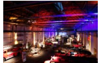
Ausstellungsdepot Schiff 10 Halle R5

Wichtige Partner sind hierbei neben dem Verein Henschelmuseum auch die KVG, die MHK, private Sammler und Industriebetriebe aus der Region. Wie