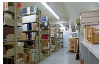
Magazin mit Bibliotheks- und Archivbestand