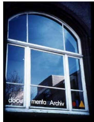
Ryszard Kasiewicz - documenta Archiv