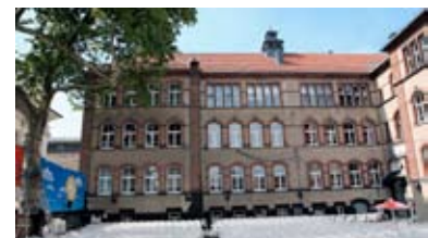
Open Air Kino im Hof des Dock 4