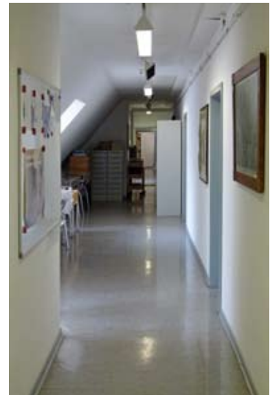
Kulturamt - D. Rothen

Zu den Leistungen des Stadtarchivs gehört die Erteilung stadtgeschichtlicher Auskünfte, die Unterstützung bei Familienrecherchen, die Beratung bei der Suche nach Quellen zur Stadtgeschichte sowie beim Lesen alter Schriften. Mit seiner historischen Bildungsarbeit ebnet das Stadtarchiv Schulen, Vereinen sowie Bürgerinnen und Bürgern den Zugang zur eigenen Vergangen-