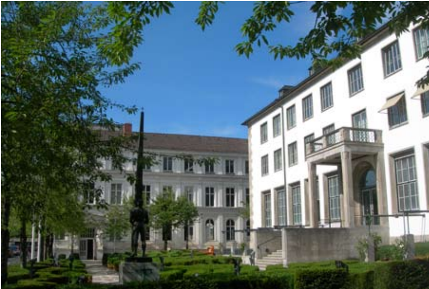
Die Filiale der Bundesbank am Ständeplatz