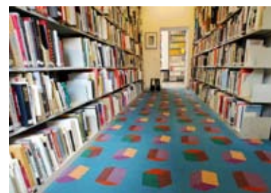
Ryszard Kasiewicz - documenta Archiv